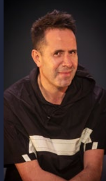
VÍCTOR TOMÉ Diseño de sonido