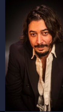
BANDOLERO Percusión y composición